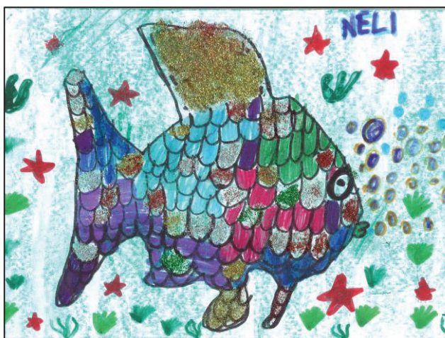
Neli Furjan, 2.b