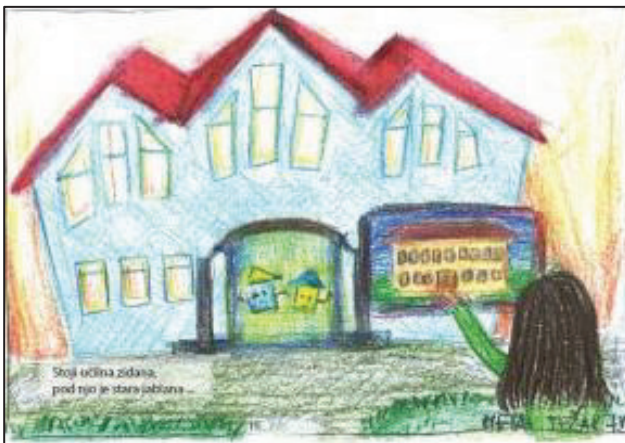
Meta Težak, 7.b