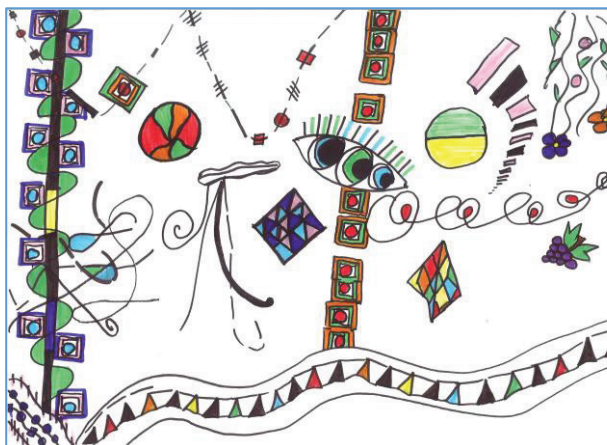
Teja Kolednik, 5. a