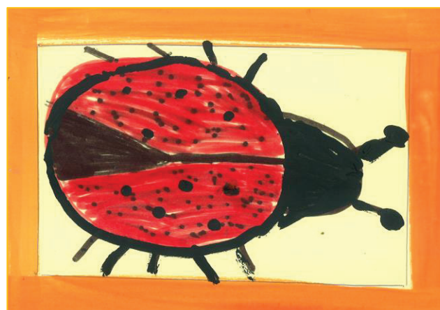
Aljaž Kopša, 2.b