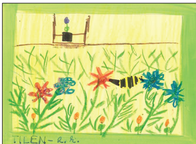
Tilen Cvetko, 2.b